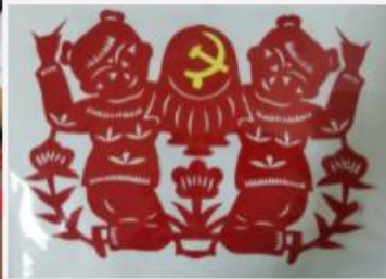
★ 迎百年华诞 ★